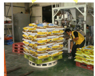
제품 회동 랩 감기