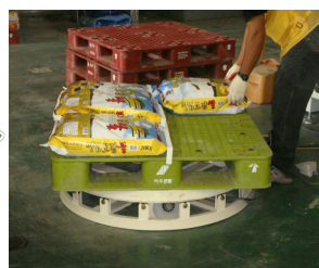
발판스위치를 눌러 파렛트를 45°, 90°, 180°, 360°로 회전하 면서 원하는 위치에 물건 적재