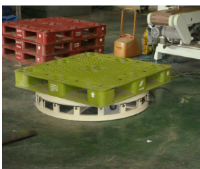
물품을 쌓기 위한 대기상태