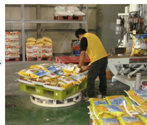
발판스위치로 파렛트 회동하면서 연속물품 적재