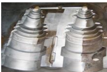
금속 표면 세정