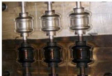
금형 치구 세정