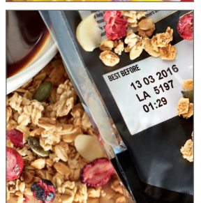
생산 운영 시간과 양질의 제품 코드를 보장하는 세계 최고 수준의 서비스.