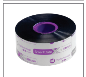
포장 유형과 요구에 따라 리본 유형 3개와 액세스리 시리즈 중에서 선택할 수 있습니다.