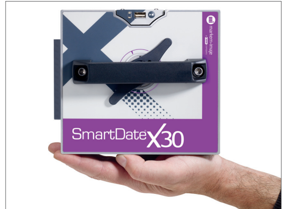
간편한 통합을 위한 컴팩트 사이즈. SmartDate X30은 시장에서 가장 작은 SmartDate 코더입니다.

단일 문의하여여 바로 연락망에 코드와 리본에 대한 전문가 지원을 요청하실 수 있습니다.