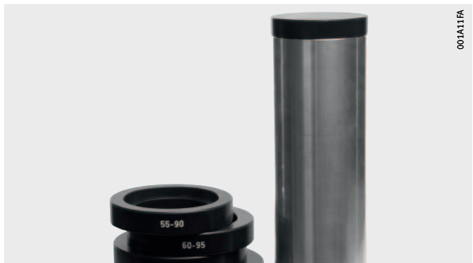
그림 4 베어링 장착에 사용되는 장착 슬리브 및 장착 링