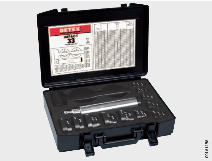
그림 1 장착 슬리브 세트 IMPACT-33