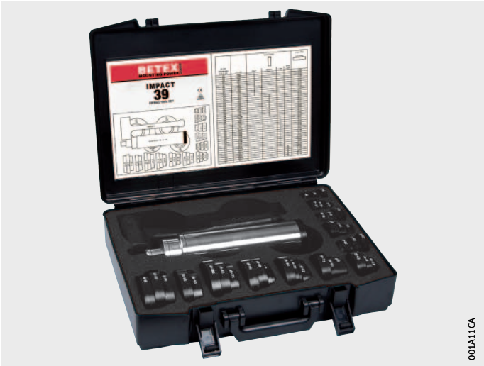
그림 2 장착 슬리브 세트 IMPACT-39