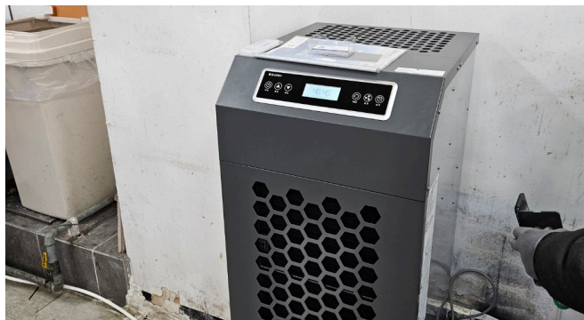
[OOO식당] 대형 뷔페 주방