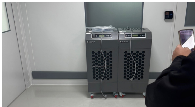
[한O약품] 공장 저온창고