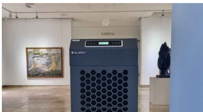
[OO미술관] 전시관 내부