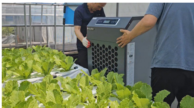
[OOO] 대형 스마트팜 비닐하우스