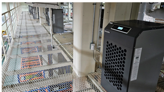
[플O원] 공장 저온창고