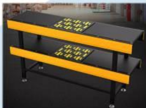
설비의 높이가 낮아 복층구조가능