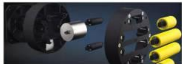
일체형 방향전환모듈 내부구조

원하는대로 배치가 가능한 "Cell 단위 Wheel sorter를 경험해 보시기 바랍니다"