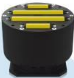
일체형 방향전환 모듈