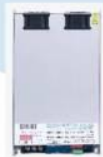
DC48V 1000W Power Supply