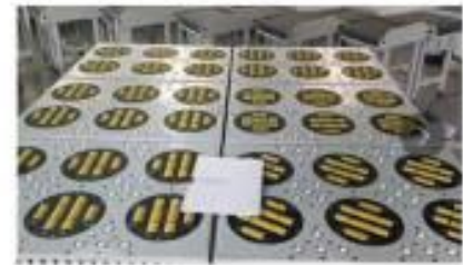
생각한대로 Wheel sorter