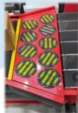
다양한 용도에 적용