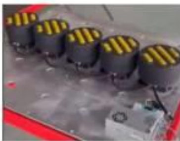
간단한 조립, 배선