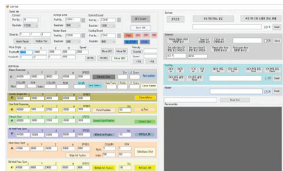
윈도우 프로그램 유체&온도 통합제어