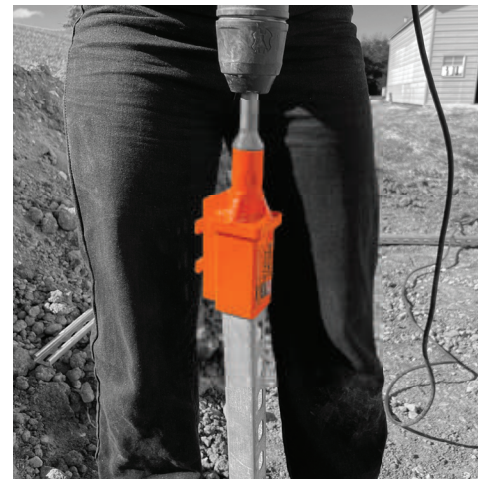
End receiver for driving from the top.