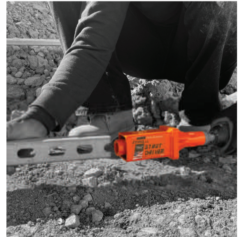
End receiver accepts 1-5/8" strut.