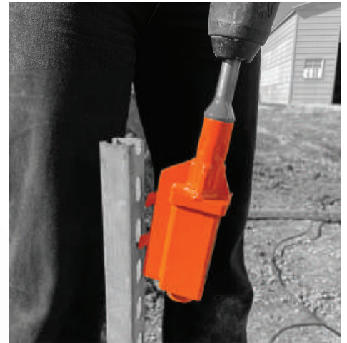
Engagement teeth to drive strut from the side.