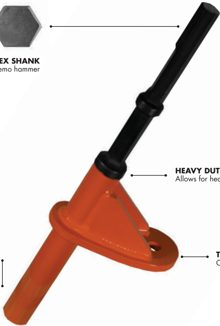
END RECEIVER Drives rod under grade