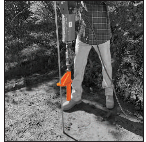
사다리 없이 막대 박기