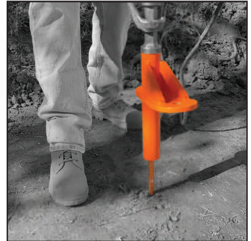
지표면 아래의 막대 꼭대기 까지 구동