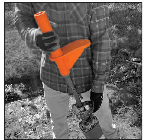
Fits in 1-1/8" hex shank jack hammer.

Ground Rod Dawg XL을 육각형 생크 잭 해머에 꽂기만 하면 됩니다. 그런 다음로드의 아랫부분을 Ground Rod Dawg XL에 끼우면 됩니다. 독특한 디자인 덕분에 Ground Rod Dawg XL이 로드에서 밀착되어 사용자가 쉽게 박을 수 있습니다. 막대를 충분히 깊이 박아 넣은 후 막대 위쪽에 있는 리시버를 사용하여 최종 경사면까지 박아 넣습니다.