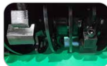
넙쿨 감김 방지 U자 날