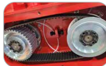
타이밍 벨트, 풀리