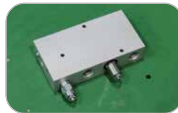
모터보호 유압 블럭