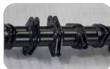
고강도 파이프 제초축