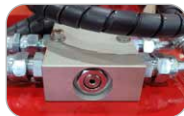
모터보호 유압 블럭