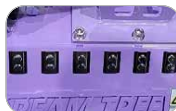
넙쿨 감김 방지 U자 날