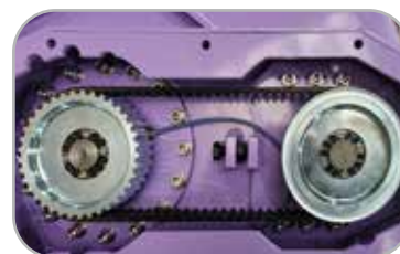
타이밍 벨트, 풀리