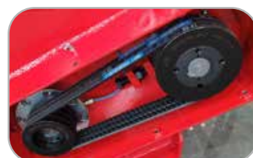
롤러형 V벨트, 테이퍼 풀리