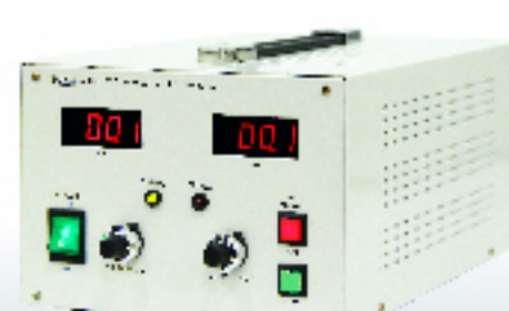
SJ-2015(H.V POWER SUPPLY)