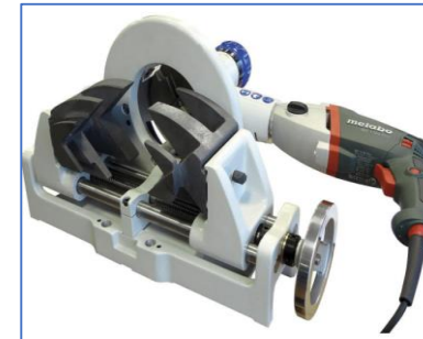
RPG-4.5S 전기식 (바이스형)